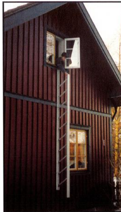
3. Stegen är klar att användas